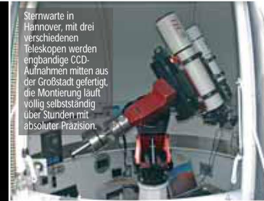
Sternwarte in Hannover, mit drei verschiedenen Teleskopen werden engbandige CCD-Aufnahmen mitten aus der Großstadt gefertigt, die Montage läuft völlig selbstständig über Stunden mit absoluter Präzision.

Auch wenn Sie Ihren Traum von einer fernsteuerbaren Sternwarte erst viel später verwirklichen können – die Paramount ME bildet bereits jetzt eine solide Basis für alle derartigen Pläne. Sie veraltet nicht dank updatefähiger Software und upgradefähiger Hardware