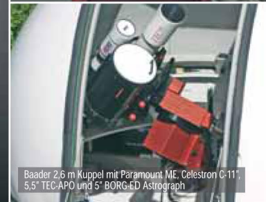
Baader 2.6 m Kuppel mit Paramount ME, Celestron C-11", 5.5" TEC-APO und 5" BORG-ED Astrograph

Die angegebenen Preise enthalten 16% MwSt. Irrtum, Preis und technische Änderungen ausdrücklich vorbehalten.