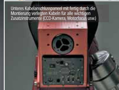
Unteres Kabelanschlusspaneel mit fertig durch die Montage verlegten Kabeln für alle wichtigen Zusatzinstrumente (CCD-Kamera, Motorfocus usw.)