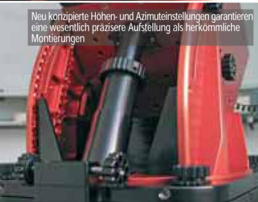
Neu konzipierte Höhen- und Azimuteinstellungen garantieren eine wesentlich präzisere Aufstellung als herkömmliche Montierungen