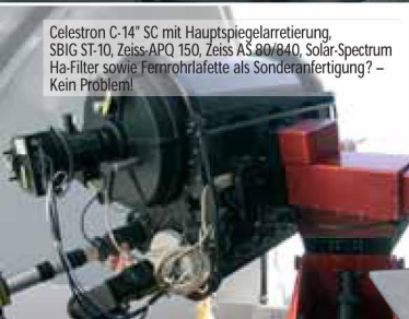
Celestron C-14™ SC mit Hauptspiegelarretierung, SBIG ST-10, Zeiss APO 150, Zeiss AS 80/840, Solar-Spektrum Ha-Filter sowie Fernrohrlafette als Sonderanfertigung? – Kein Problem!