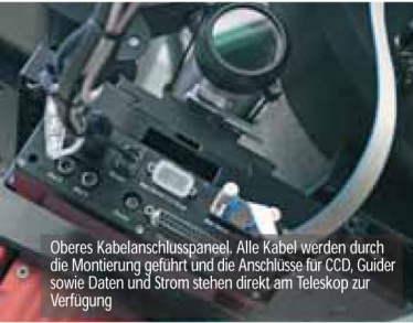
Oberes Kabelanschlusspaneel. Alle Kabel werden durch die Montage geführt und die Anschlüsse für CCD, Guider sowie Daten und Strom stehen direkt am Teleskop zur Verfügung

Weitere Infos zur PARAMOUNT ME auf unserer Internetseite unter: http://www.baader-planetarium.de/montierungen/mont-start.htm#bisque