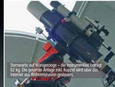
Sternwarte auf Wangerooge – die Instrumentenlast beträgt 62 kg. Die gesamte Anlage inkl. Kuppel wird über das Internet aus Wilhelmshaven gesteuert.