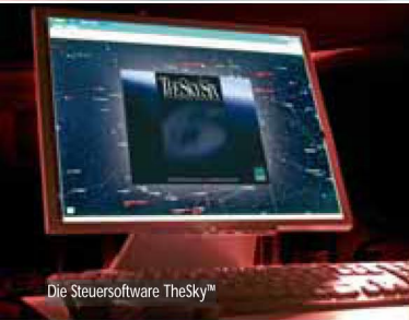
Die Steuersoftware TheSky™