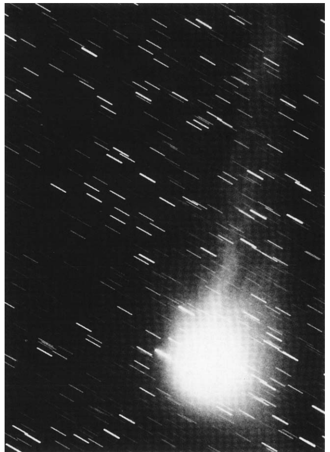
Komet Levy (1990c) v. 16.8.1990

Nur so kann man sich voll auf die Nachführung konzentrieren.