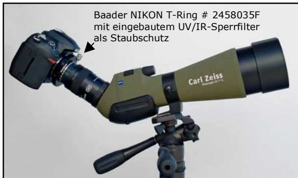
mit 24 mm Brennweite

Zeiss Diascope TFL # 528015 mit Baader Hyperion Zoom-Okular # 2454824, T-2 Schnellwechselsystem (T2# 6/7) # 2456321 und Hyperion Zoom T-Ring SP54 / T-2 # 2958085 ergibt 5 Vergrößerungen!